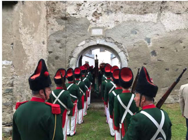
Die Metnitzer Schützengarde bei der Brückenweihe im Juni 2017