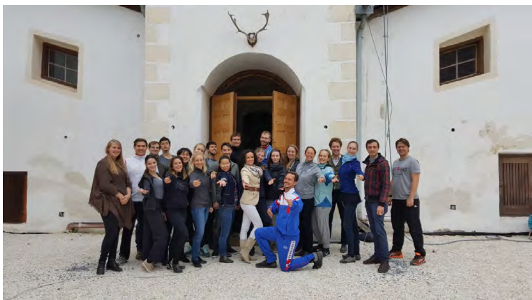
Seit zwei Jahren ebenfalls fester Bestandteil ist das Übungscamp der Wiener Walzer Formation der Tanzschule Elmayer, hier im Oktober 2017