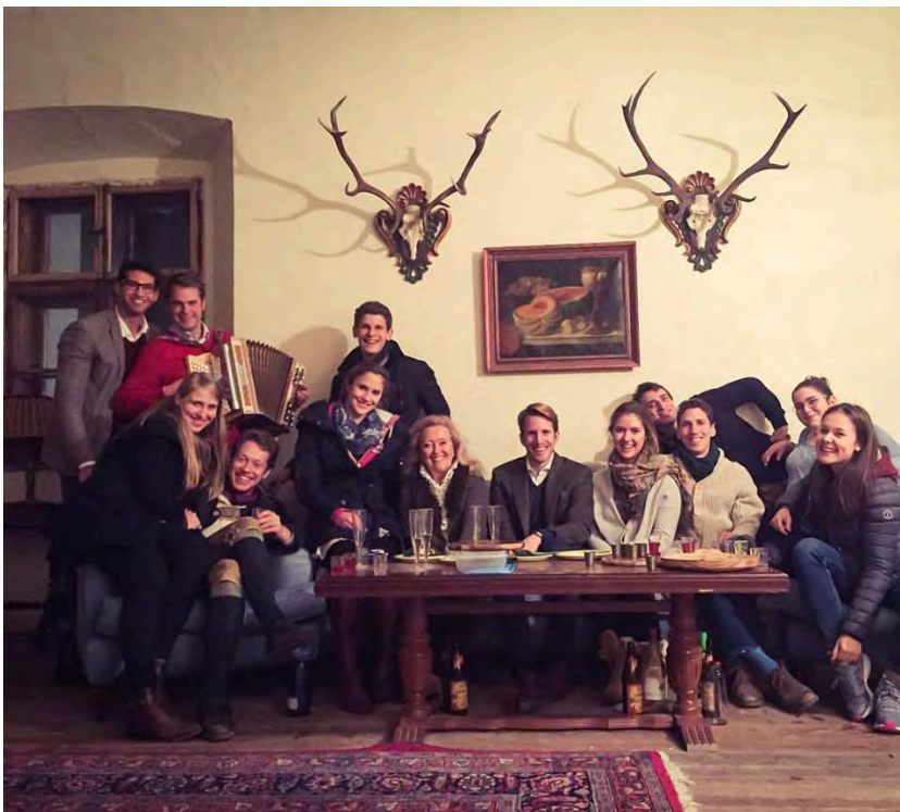
Das erste Wolfgangkonzert im Oktober 2016

Bereits seit drei Jahren ist das Haus wieder für die Öffentlichkeit zugänglich. Seit dem ersten großen Abend, dem Wolfgangkonzert 2016 konnten wir einige weitere Konzertabende, die Brückenweihe gemeinsam mit den Metnitzer Schützen, und den ersten Ball im September 2018 feiern.