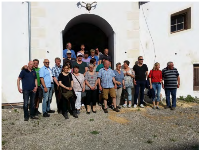
Eine besondere Freunde war der Besuch ehemaliger Schlosskinder und Betreuer aus Datteln im Juli 2017