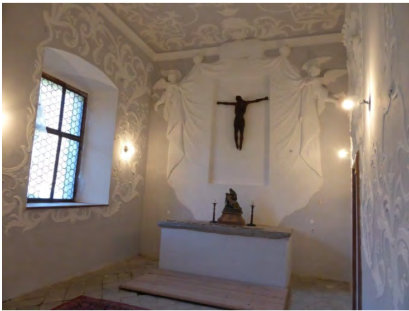
Die Kapelle nach der Renovierung

Bereits seit der Gründung des Vereins der Freunde von Schloss Grades unterstützt dieser die Bemühungen. Die können sich durchaus sehen lassen. Seit dem Jahr 2015 wurden im Schloss 12 Prunkräume restauriert, vier Badezimmer installiert, das Dach ausgebessert, archäologische Grabungen durchgeführt und etliche Kilometer neuer Stromleitungen verlegt. Der Innenhof wurde mit Hilfe der Gemeinden Metnitz und Strassburg verschönert und das Bodenniveau ausgeglichen. Eine neue Schlossbrücke wurde Dank der Unterstützung der Kulturabteilung des Landes Kärnten errichtet. Die Räume im Erdgeschoss haben zu einem guten Teil wieder Fußböden und fast jeder Raum verfügt über Fenster und Türen.