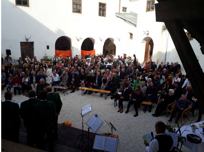
Ein besonderer Höhepunkt war auch das 1. Schlosshofsingen veranstaltet vom Gradeser Gesangsverein im September 2017