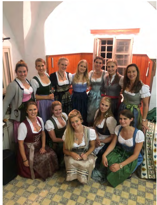
Die Gäste waren aus Großbritannien, Italien, Frankreich, Russland, Deutschland und den USA angereist.