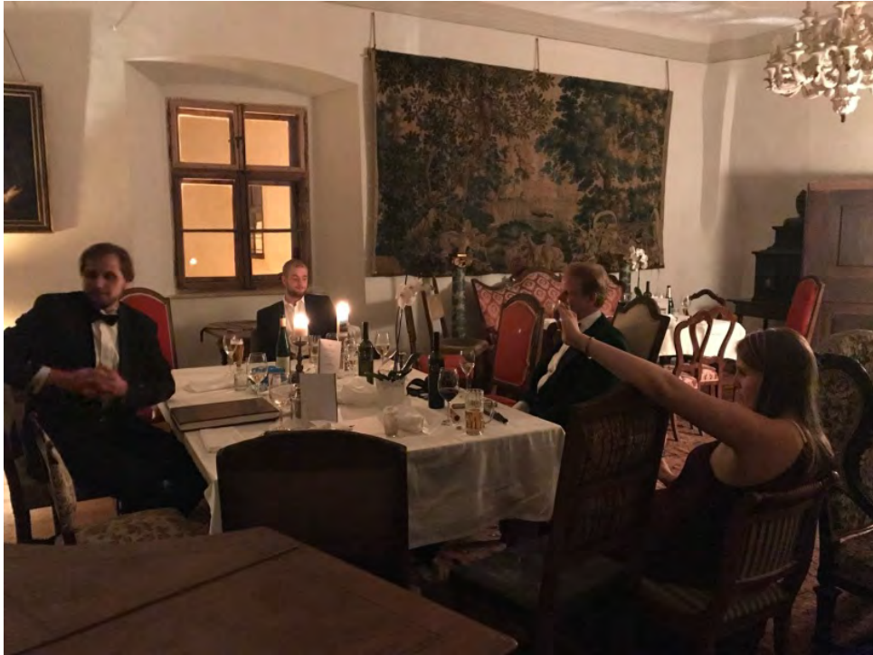
Ein aufregendes Wochenende unser Probelauf für kommende Ereignisse: Der 1. Ball auf Schloss Grades im September 2018